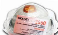
2850N95 Locker de Respiradores